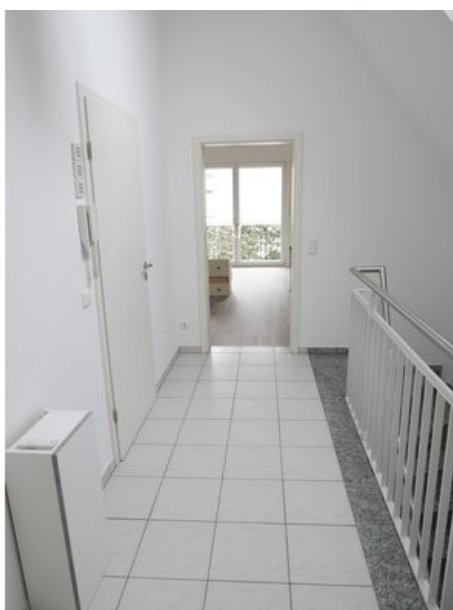
Diele 3. OG (DG)