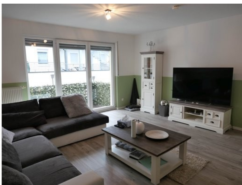
Kinderzimmer im 2. OG (aktuell Wohnzimmer)