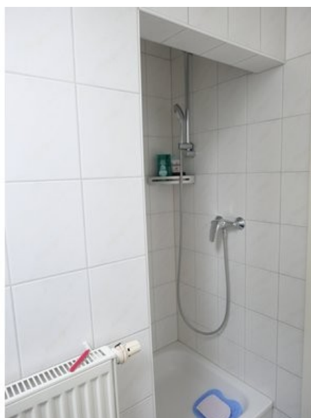
Duschbad mit Fenster und