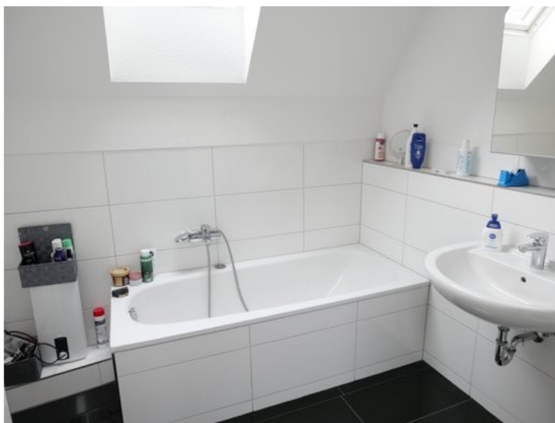
Wannenbad mit Fenster im 3. OG