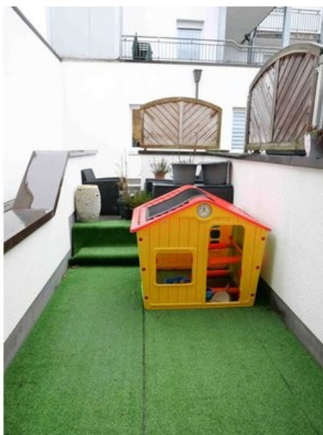
Balkonterrasse im 1. OG