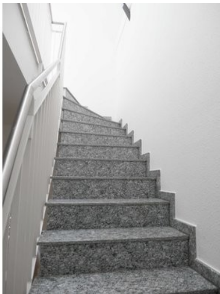
Treppenaufgang ins 3. OG