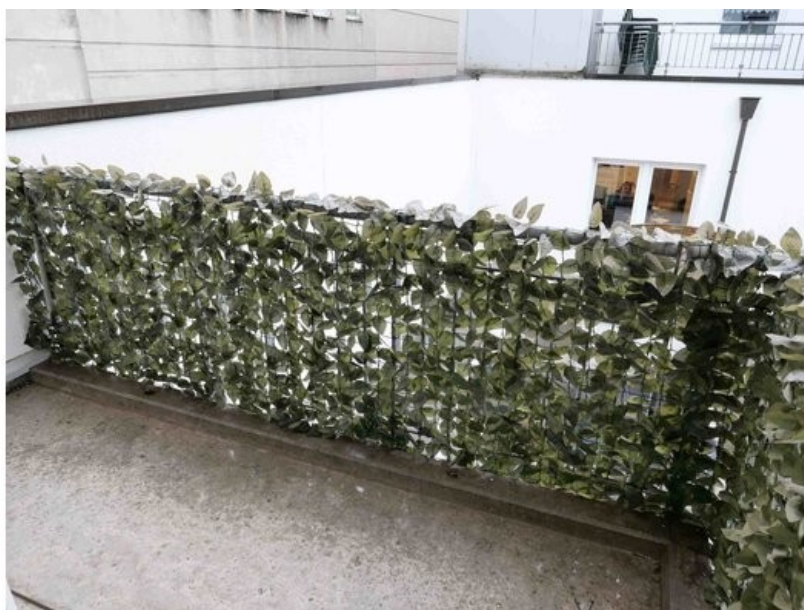
Balkon im 2. OG