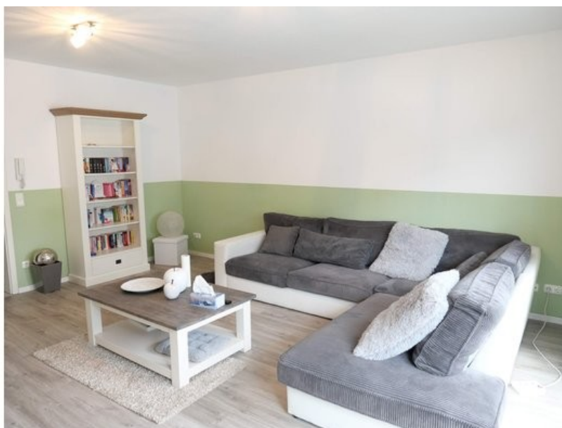
Kinderzimmer im 2. OG (aktuell Wohnzimmer)