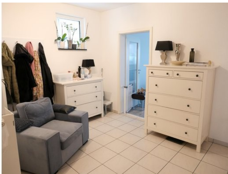
Diele im 1. OG