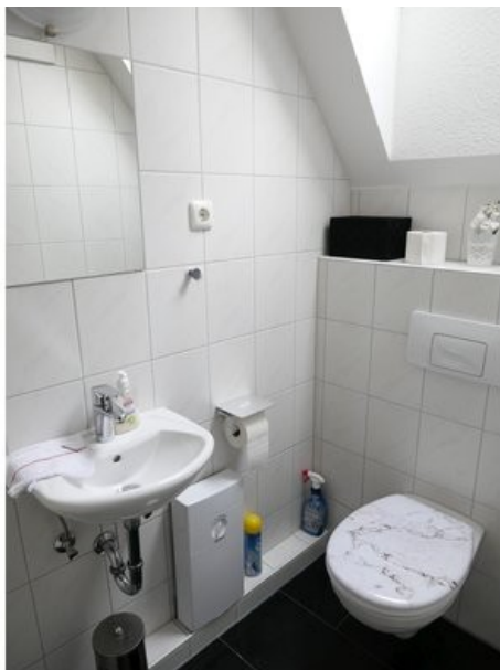
WC im 3. OG