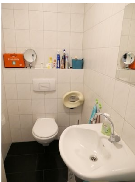
Gäste-WC im 1. OG