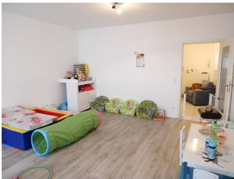
Wohnzimmer im 1. OG (z. Z. Kindertagsstätte)