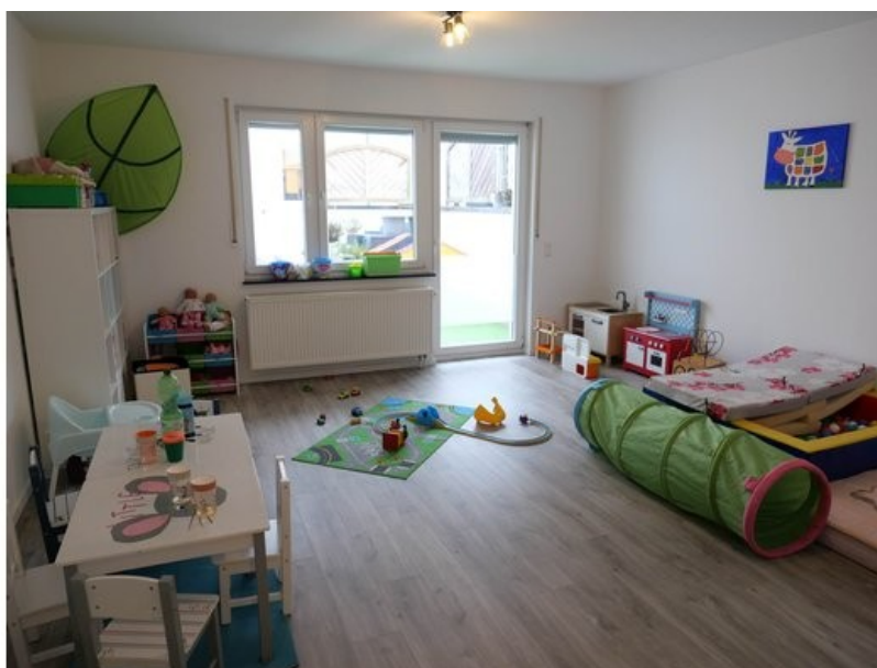
Wohnzimmer im 1. OG (z. Z. Kindertagesstätte)